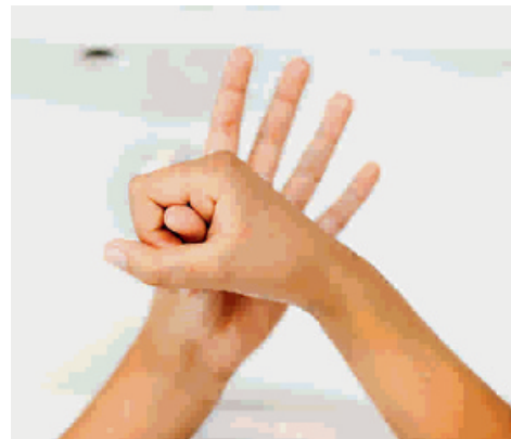
Herefter indgnides begge tommelfinger.