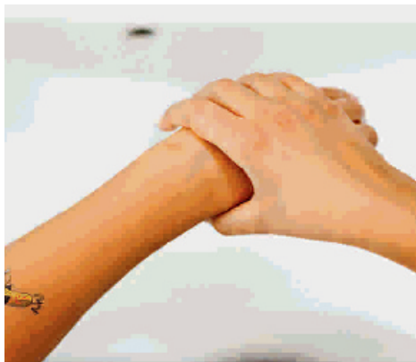
Geléen indgnides rundt om håndleddene.