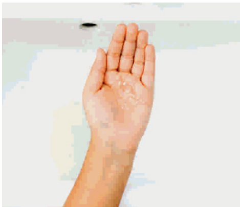
Tag en portion gelé i hånden.